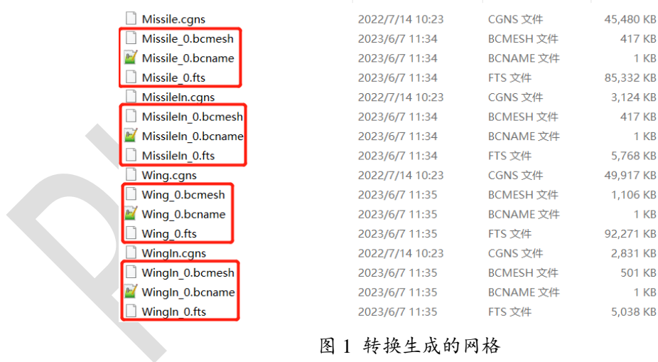
图 1 转换生成的网格

按照上面的参数设置，只需执行一次程序即可完成对所有 4 部分的网格转换操作。最终在 grid 文件夹中转换生成 Missile_0.fts、MissileIn_0.fts、Wing_0.fts、WingIn_0.fts 等 4 个.fts 格式的网格文件。